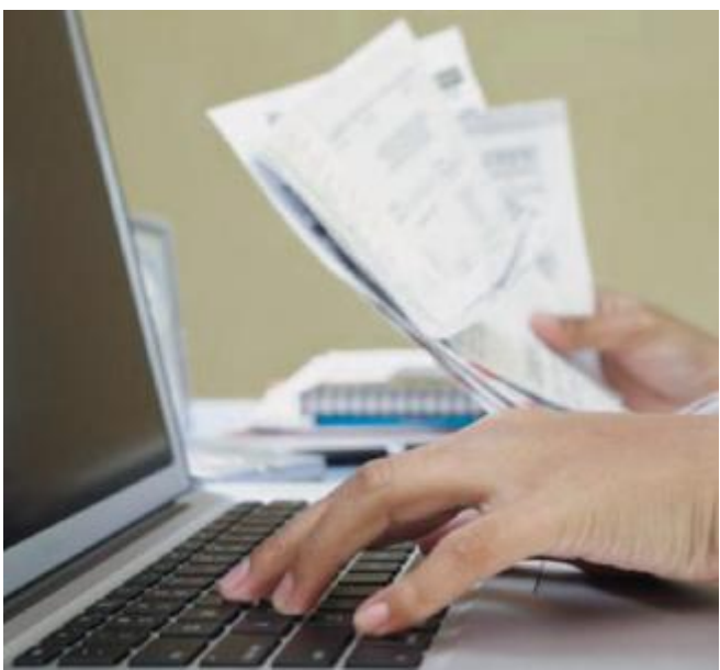
Le aziende possono mettere all'asta le fatture su una piattaforma

WorkInvoice ha iniziato a operare nel 2015 e ad oggi ha gestito aste di fatture commerciali per 57 milioni, cifra che sale di continuo perché gli scambi ammontano a 2 milioni a settimana. La piattaforma si rivolge a tutte le pmi con un fatturato superio-